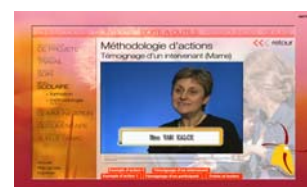
Extraits de pages du cdrom